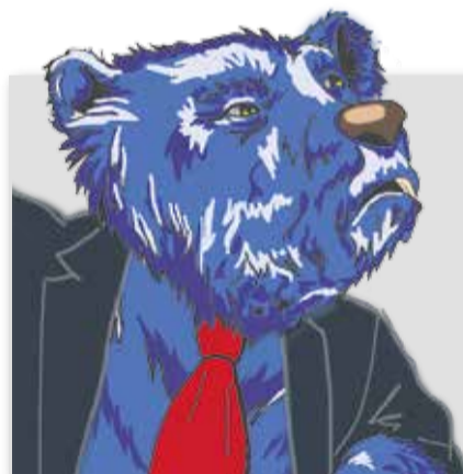
Иллюстрация Н. Деревягиной

Все это не просто предложения, а внесенные законопроекты. Но правительство и партия власти предпочитают их игнорировать, вместо этого вводя дополнительные налоги и платежи, замораживая индексацию пенсий и повышая пенсионный возраст.