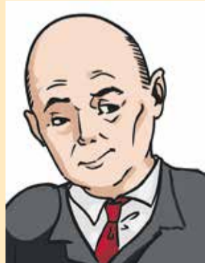
Иллюстрация М. Липатовой

В этом году федеральный бюджет России дефицитный, то есть расходов в нем больше, чем доходов. При этом 14 триллионов рублей лежат без движения в Фонде национального благосостояния. На какой черный день бережет свою кубышку правительство? Возможно, для министра и чиновников он никогда и не наступит, а для большинства россиян наступил уже давно!