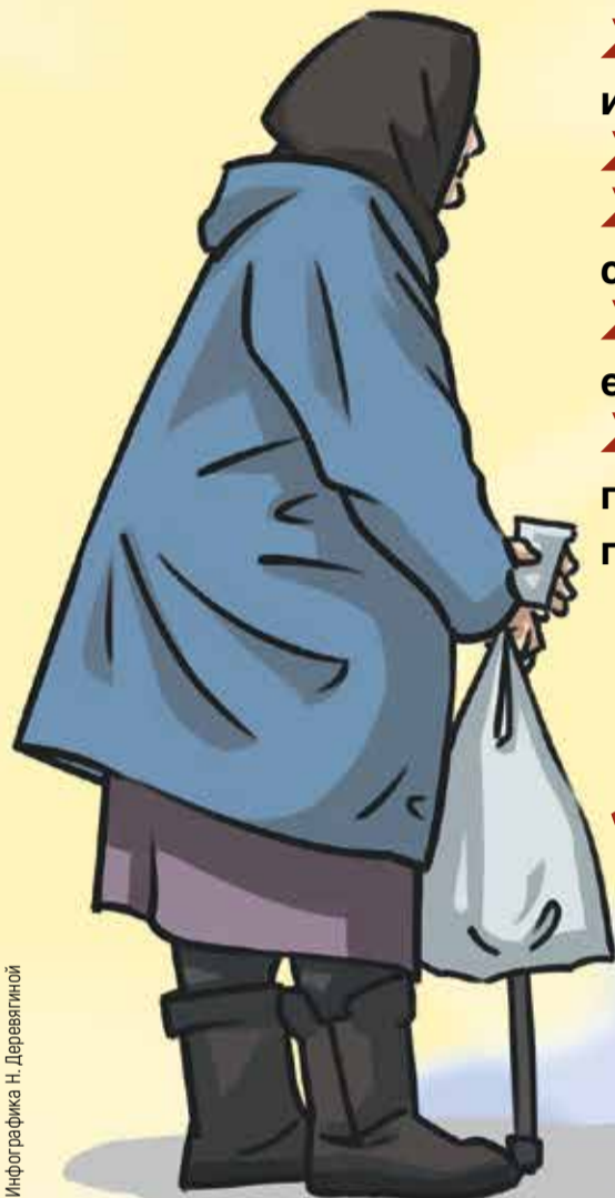
Инфографика Н. Деревягиной