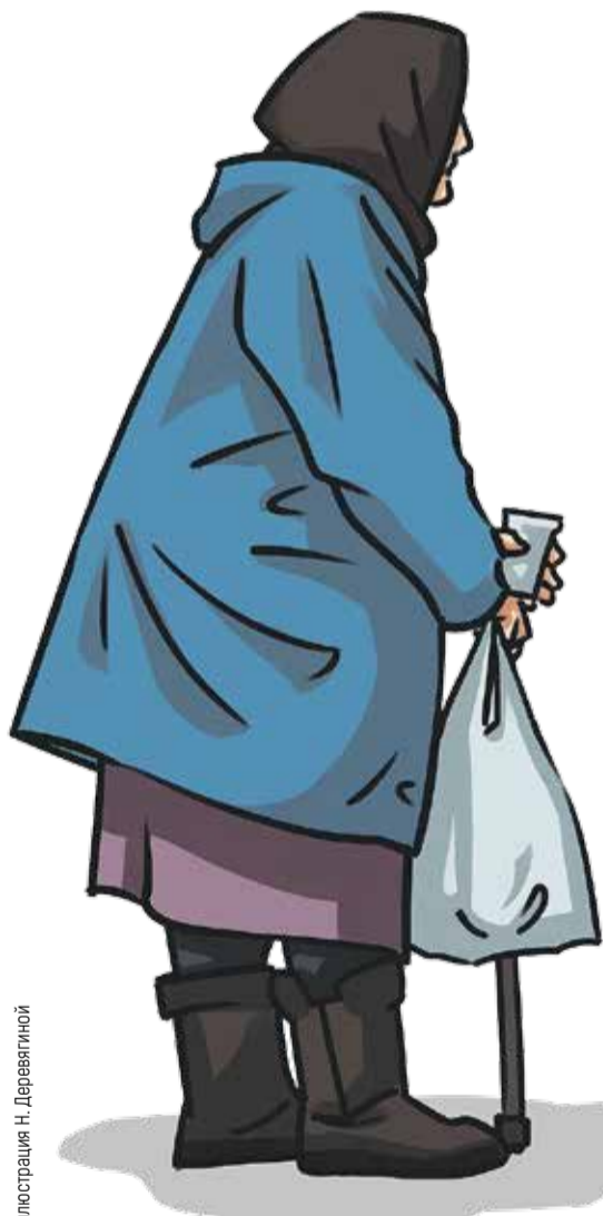
Иллюстрация Н. Деревягиной