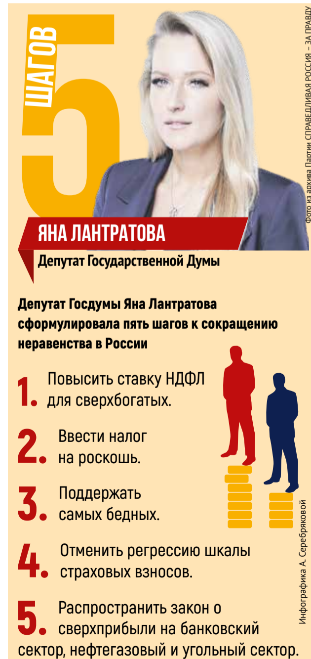
Инфографика А. Серебряковой

Депутаты СПРАВЕДЛИВОЙ РОССИИ – ЗА ПРАВДУ внесли законопроект, в соответствии с которым следует отказаться от определения прожиточного минимума по медианной зарплате. Партия СПРАВЕДЛИВАЯ РОССИЯ – ЗА ПРАВДУ предлагает использовать метод, который учитывает натуральный состав продовольственной, непродовольственной корзины и платных услуг. Таким образом, ПМ (а вслед за ним МРОТ, размер пособий, доплат к пенсии и прочее) увеличится в разы! Вслед за ними вырастет и уровень жизни у самых бедных россиян.